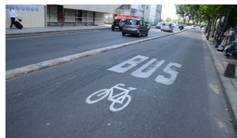
Author: Steven Lek

Το πρώτο βήμα για την αντιμετώπιση των κυκλοφοριακών προβλημάτων και της ατμοσφαιρικής ρύπανσης κάνει η Θεσσαλονίκη, που εδώ και πολλά χρόνια έχει