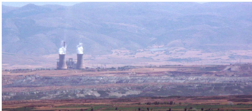
Author: Charstaras A

Εντός των επόμενων 20-25 ημερών εκτιμάται ότι θα υποβάλλουν οι επιθεωρητές μεταλλείων του ΥΠΕΝ το πόρισμά τους για την έκταση των ζημιών από την καθίζηση στο ορυχείο της ΔΕΗ στο Αμύνταιο, αλλά και τις συνθήκες υπό από τις οποίες συνέβη το περιστατικό. Τα παραπάνω επισήμανε ο αρμόδιος υπουργός, Γιώργος Σταθάκης, μιλώντας στον ραδιοφωνικό σταθμό «Στο Κόκκινο», ενώ πρόσθεσε ότι άμεσα πρόκειται να προχωρήσει η σύσταση της Ειδικής Επιτροπής Εμπειρογνομόνων, που θα υποβάλει πόρισμα για τον ίδιο λόγο.