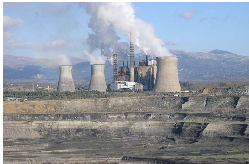
Dr. Peter Tzeferis

Βιώσιμη και σύμφωνη με τα κριτήρια που θέτει η Συμφωνία των Παρισίων είναι η ελληνική πρόταση προς την Ευρωπαϊκή Επιτροπή για την αποεπένδυση περίπου του 40% του λιγνιτικού δυναμικού της ΔΕΗ, όπως επισήμανε από τη Θεσσαλονίκη και την 82η ΔΕΘ, ο υπουργός Περιβάλλοντος και Ενέργειας, Γεώργιος Σταθάκης. Πρόσθεσε ότι στο επόμενο διάστημα θα γίνουν διαπραγματεύσεις για την οριστικοποίηση της πρότασης, με προοπτική το market test να “τρέξει” τον Οκτώβριο, προσελκύοντας ισχυρό επενδυτικό ενδιαφέρον. Η δε αποεπένδυση εκτιμάται ότι θα ολοκληρωθεί ως τα μέσα του 2018. Μιλώντας σε εκδήλωση της ΔΕΗ, σε συνεργασία με την ΔΕΘ HELEXPO και του Ινστιτούτου Ενέργειας ΝΑ Ευρώπης, στο πλαίσιο της 82ης ΔΕΘ, ο κ.Σταθάκης επισήμανε ότι δεν θα δικαιωθούν όσοι υποστηρίζουν ότι δεν θα υπάρξει ισχυρό ενδιαφέρον στο πλαίσιο της διαδικασίας του market test. Πρόσθεσε δε ότι «επιδίωξη του ενεργειακού σχεδιασμού της κυβέρνησης είναι η μέγιστη δυνατή συμμετοχή του λιγνίτη στο ενεργειακό μίγμα της Ελλάδας το 2030, υπό το φως των περιβαλλοντικών στόχων, για τους οποίους η χώρα έχει δεσμευτεί με τη Συμφωνία των Παρισίων», κάτι που είναι εφικτό χάρη στις νέες τεχνολογίες.