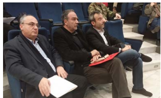
Φωτογραφίες: Δήμος Θεσσαλονίκης, Αννέτα Καρολίδου