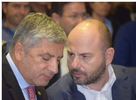
ο Πρόεδρος της ΚΕΔΕ Γιώργος Πατούλης και ο πρόεδρος του ΤΕΕ Γιώργος Στασινός

«Οι επενδύσεις στην ενεργειακή εξοικονόμηση και στις ΑΠΕ στο υπάρχον κτιριακό απόθεμα μπορούν να αποτελέσουν την «ατμομηχανή» της επανεκκίνησης για την οικοδομή και την οικονομία», τόνισε ο πρόεδρος του ΤΕΕ Γιώργος Στασινός, μιλώντας στην εκδήλωση με θέμα «Χρηματοδοτικά Εργαλεία και καλές πρακτικές για την υλοποίηση