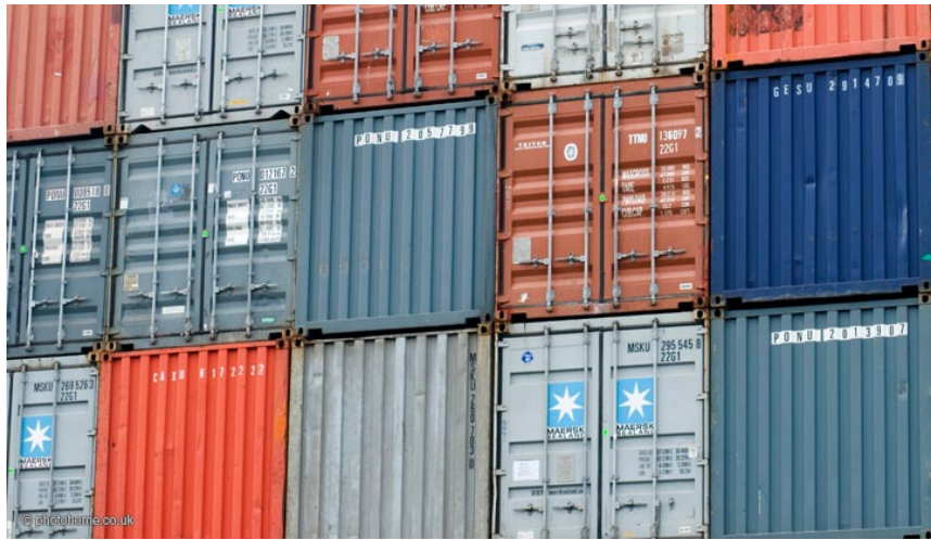
Author: steve gibson from Airlie Beach, Australia

Ξεκίνησε η αντίστροφη μέτρηση για την κατάθεση των δεσμευτικών προσφορών για το 67% του Οργανισμού Λιμένος Θεσσαλονίκης (ΟΛΘ), καθώς αύριο Παρασκευή εκπνέει η σχετική προθεσμία. Προσφορές εκτιμάται ότι θα καταθέσουν και οι τέσσερις υποψήφιοι που παρέμειναν ενεργοί στη δεύτερη φάση του διαγωνισμού. Μάλιστα, όπως δήλωσε στο ΑΠΕ-ΜΠΕ ο πρόεδρος του ΟΛΘ, Κωνσταντίνος Μέλλιος, εκφράζοντας μια -προσωπική όπως διευκρίνισε- πεποίθηση "θα είναι ο πρώτος διαγωνισμός της τελευταίας πενταετίας, στο πλαίσιο και των υποχρεώσεων της χώρας προς τους δανειστές της για τις ιδιωτικοποιήσεις, στον οποίο θα συμμετάσχει πάνω από ένας επενδυτής και θα υπάρξει πραγματικός ανταγωνισμός, όχι σε επίπεδο χωρών, αλλά σε επίπεδο ιδιωτικών εταιρειών".