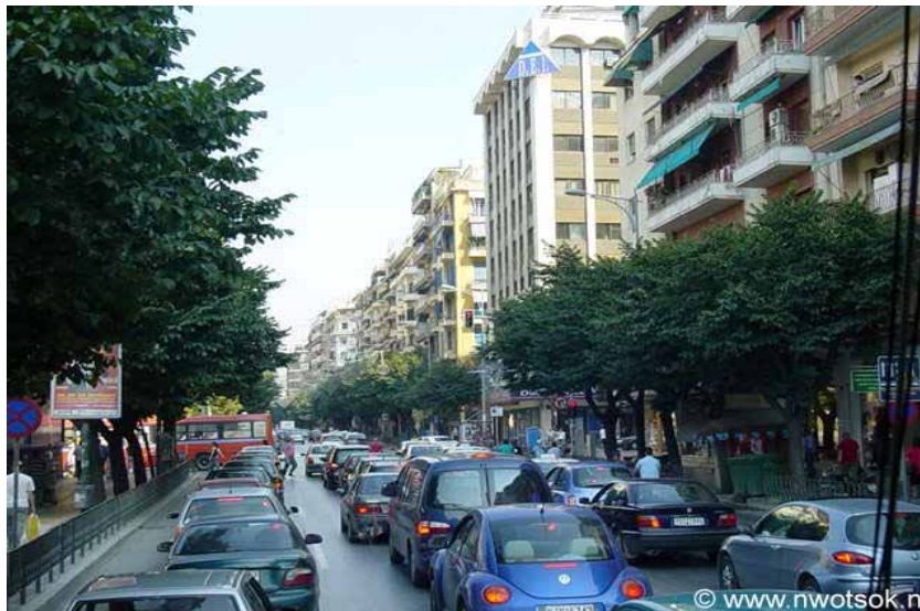
ΔΕΝΔΡΟΣΤΟΙΧΙΕΣ ΣΤΗΝ ΟΔΟ ΤΣΙΜΙΣΚΗ

Οι οδικές νησίδες, είτε λόγω περιορισμένου μεγέθους είτε λόγω επιλογών φύτευσης, συνήθως αποτελούν διακοσμητικά στοιχεία και σε ελάχιστες περιπτώσεις περιλαμβάνουν δένδρα.