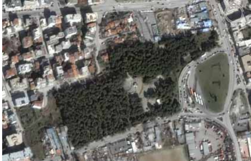
ΑΛΣΟΣ ΝΕΑΣ ΕΛΒΕΤΙΑΣ

Σε αντίθεση με την Αθήνα, στην Θεσσαλονίκη υπάρχουν ελάχιστα άλση κυρίως στις παρυφές του πολεοδομικού συγκροτήματος όπως το Άλσος της Νέας Ελβετίας, το άλσος των Συκεών και το άλσος της Πολίχνης. Η χρήση τους είναι περιορισμένη καθώς η πρόσβαση σε αυτά είναι δύσκολη (λόγω περιφραξης) ή επικίνδυνη (λόγω συγκέντρωσης περιθωριακών).