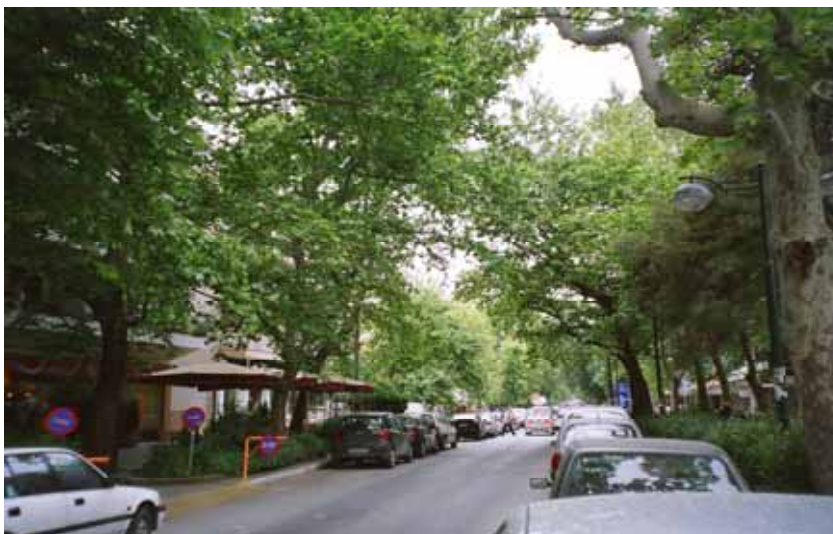
ΔΕΝΔΡΟΣΤΟΙΧΙΕΣ ΣΤΗΝ ΟΔΟ ΣΟΦΟΥΛΗ