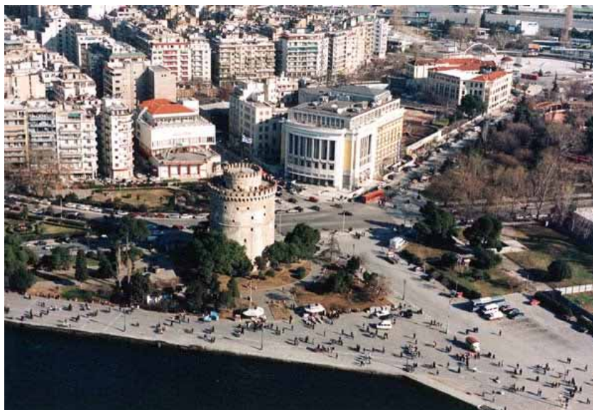
ΠΑΡΚΟ Λ. ΠΥΡΓΟΥ

Στις κατά καιρούς σχεδιαστικές επεμβάσεις που προέρχονται κυρίως από τους Δήμους κυριαρχεί μια παρωχημένη λογική «καλλωπισμού» (εκτεταμένες πλακοστρώσεις, σιντριβάνια, κιγκλιδώματα, παρτέρια με διακοσμητικές φυτεύσεις)