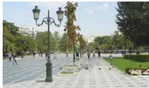
ΠΛΑΤΕΙΑ ΔΙΚΑΣΤΗΡΙΩΝ - ΕΚΤΕΤΑΜΕΝΕΣ ΠΛΑΚΟΣΤΡΩΣΕΙΣ