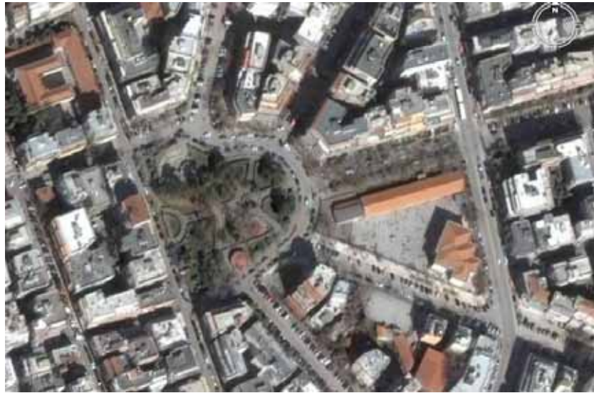
ΠΛΑΤΕΙΑ ΟΔΟΥ ΚΡΗΤΗΣ