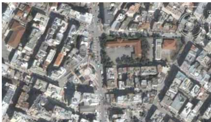
ΚΕΝΤΡΙΚΗ ΠΛΑΤΕΙΑ ΣΤΟ ΚΟΡΔΕΛΙΟ