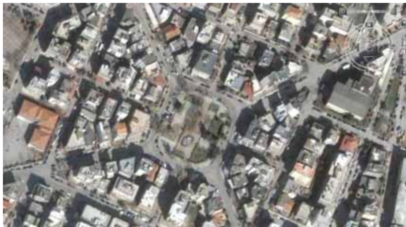
ΠΛΑΤΕΙΑ ΤΕΡΨΙΘΕΑΣ ΣΤΗ ΣΤΑΥΡΟΥΠΟΛΗ