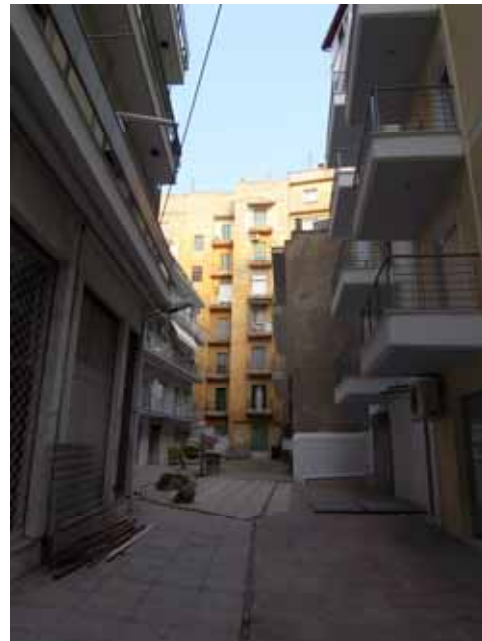
ΣΥΝΗΘΕΙΣ ΠΕΡΙΠΤΩΣΕΙΣ ΑΚΑΛΥΠΤΩΝ ΧΩΡΩΝ ΟΙΚΟΔΟΜΙΚΩΝ ΤΕΤΡΑΓΩΝΩΝ

Από την Θεσσαλονίκη δεν λείπει μόνο το πράσινο γενικώς, αλλά κυρίως το συγκροτημένο πράσινο. Όχι δηλαδή το αποσπασματικό, παρτέρια ή μεμονωμένες νησίδες, που είναι κι αυτά χρήσιμα, αλλά δεν αποτελούν ένα λειτουργικό πράσινο που συμβάλλει στη βελτίωση των περιβαλλοντικών συνθηκών στην πόλη και δημιουργεί προϋποθέσεις χρήσης από τους πολίτες στην καθημερινή τους ζωή.