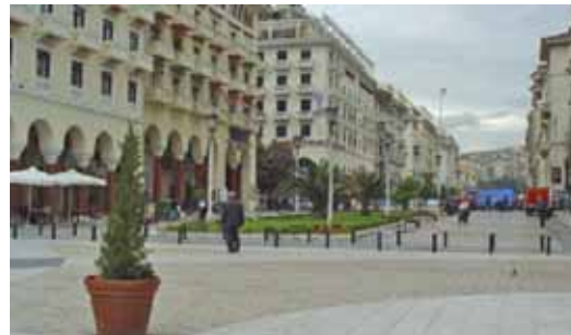
ΠΛΑΤΕΙΑ ΑΡΙΣΤΟΤΕΛΟΥΣ - ΝΗΣΙΔΕΣ ΠΡΑΣΙΝΟΥ ΜΕ «ΔΙΑΚΟΣΜΗΤΙΚΗ» ΦΥΤΕΥΣΗ