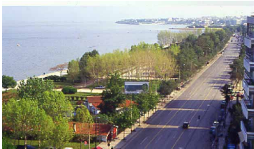
ΠΑΡΚΟ ΝΕΑΣ ΠΑΡΑΛΙΑΣ