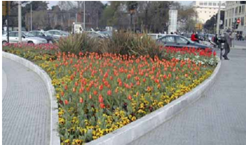
ΟΔΙΚΗ ΝΗΣΙΔΑ (ΧΑΝΘ)