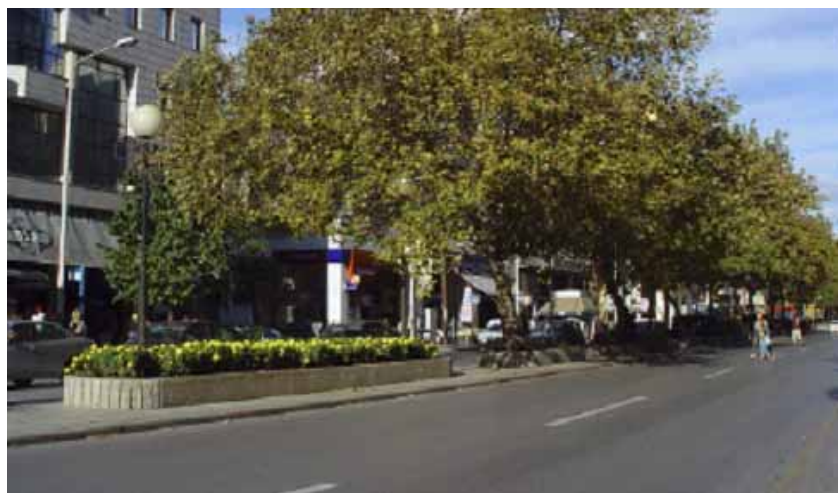
ΟΔΙΚΗ ΝΗΣΙΔΑ (Ν. ΕΓΝΑΤΙΑ)