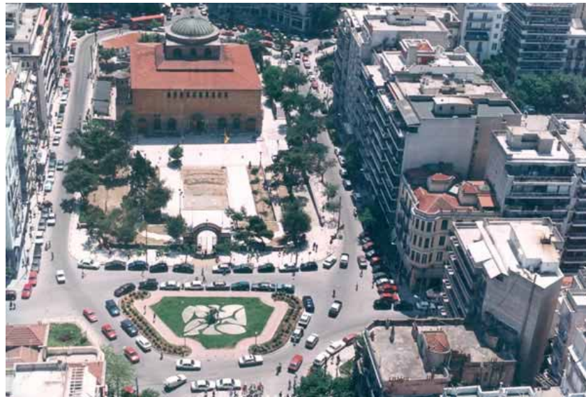
ΠΛΑΤΕΙΑ ΑΓΙΑΣ ΣΟΦΙΑΣ