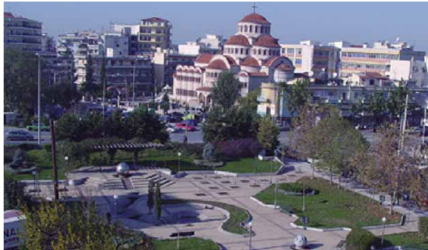
ΠΑΡΚΟ ΣΥΝΟΙΚΙΑΣ (ΒΟΥΛΓΑΡΗ)