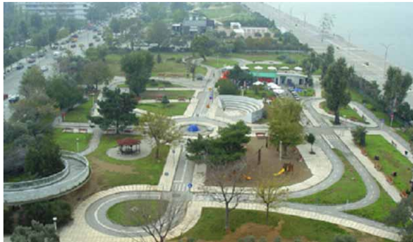
ΘΕΜΑΤΙΚΟ ΠΑΡΚΟ (ΠΟΔΗΛΑΤΟΔΡΟΜΙΟ) ΣΤΗ ΝΕΑ ΠΑΡΑΛΙΑ