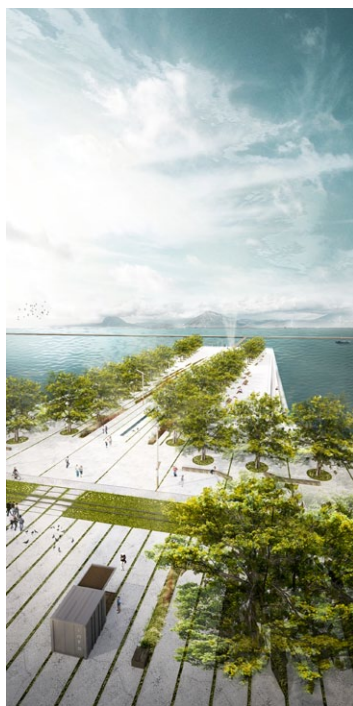
1ο βραβείο διαγωνισμού

Ο εν λόγω κύκλος διαλέξεων, αποτελεί μια προσπάθεια του ΤΕΕ/ΤΚΜ να δώσει ένα βήμα δημόσιου διαλόγου για την αρχιτεκτονική και την πόλη της Θεσσαλονίκης, να διερευνήσει το έργο και τις ιδέες των νέων της αρχιτεκτόνων σε μια εποχή που η χώρα μαστίζεται από τη συνεχιζόμενη φυγή του επιστημονικού και δημιουργικού της κεφαλαίου, αλλά και να αναδείξει τα θέματα που διαπραγματεύονται οι πρόσφατοι αρχιτεκτονικοί διαγωνισμοί, παρουσιάζοντας ιδέες, λύσεις και εφαρμοσμένο έργο.