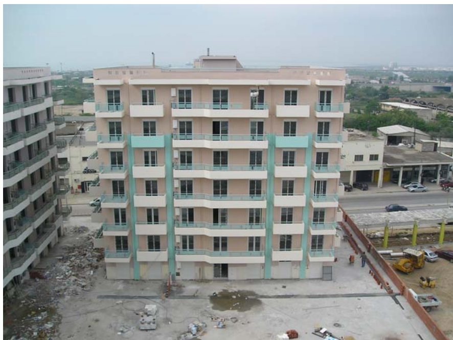
Φωτ. 53. Λανόκηποι

Όπως σημειώνεται και στην περίπτωση της Νικόπολης, πιστεύουμε ότι η συγκυρία της ύπαρξης μεγάλου αριθμού παλινοστούντων μεταναστών μαζί