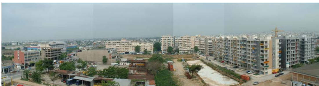
Φωτ. 59,40,41,42,43. Λανόκηποι