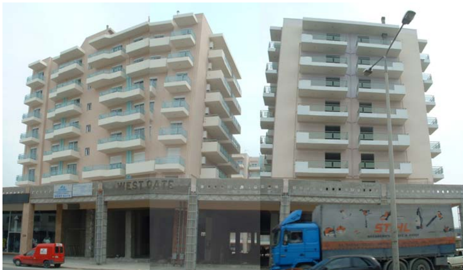
Φωτ. 51. Το δεύτερο συγκρότημα πολυκατοικιών στους Λαχανόκηπους

Οι μεγάλες κατασκευαστικές εταιρείες που ανεγείρουν τα συγκροτήματα των οικοδομών εκτός από την κατασκευή των χώρων κατοικίας διαμορφώνουν πλήρως και το σύνολο των κοινοχρήστων χώρων του οικοδομικού τετραγώνου αφού αυτοί αντιστοιχούν σε μια ενιαία ιδιοκτησία. Στη μία περίπτωση αυτό γίνεται με την διαμόρφωση ενός εσωτερικού αιθρίου με πράσινο και πεζοδρόμους, το οποίο υπολείπεται ως κοινόχρηστος χώρος από την περιμετρική χωροθέτηση των πολυκατοικιών. Στη δεύτερη περίπτωση ο κοινόχρηστος χώρος εμφανίζεται λιγότερο οργανωμένος αφού αφενός οι πολυκατοικίες παρατάσσονται παράλληλα μέσα στο οικοδομικό τετράγωνο και αφετέρου η διαμόρφωσή τους περιλαμβάνει μόνο πλακοστρώσεις και υποδομή απορροής ομβρίων. Στα δύο συγκροτήματα τα ισόγεια διαμορφώνονται με κυρίως με pilotis και κάποιους χώρους καταστημάτων.