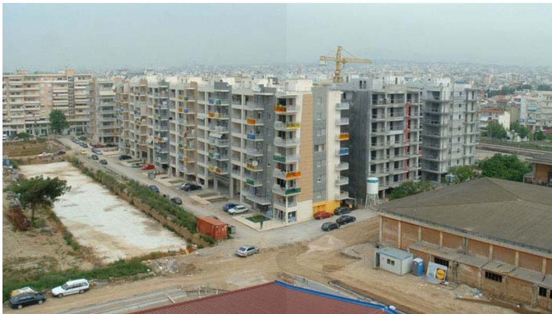
Φωτ. 50. Το πρώτο συγκρότημα πολυκατοικιών στους Λαχανόκηπους

Στην περιοχή αυτή εντοπίστηκαν δύο συγκροτήματα πολυκατοικιών, το καθένα από τα οποία καταλαμβάνει την έκταση ενός ολόκληρου οικοδομικού τετραγώνου. Τα οικοδομικά αυτά τετράγωνα βρίσκονται σε μια πολυγωνική νησίδα που οριοθετείται νότια από την οδό Μοναστηρίου και βόρεια από τις σιδηροδρομικές γραμμές.