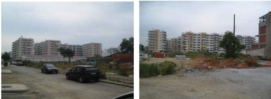
Φωτ. 57,58. Λανόκηποι

για τους γηγενείς. Βέβαια όπως προαναφέρθηκε η περιοχή διανύει μια φάση μετασχηματισμού προς την κατεύθυνση της γενικότερης αναβάθμισης. Το κτιριακό απόθεμα της περιοχής φαίνεται να ανανεώνεται διαρκώς ενώ δεν λείπουν και οι βασικές υποδομές και τα δίκτυα. Βασική υστέρηση παρουσιάζεται στην ύπαρξη κοινωφελών χρήσεων όπως σχολεία, πάρκα, χώρους πολιτισμού, εξυπηρετήσεις κλπ. ενώ πιο έντονα είναι τα προβλήματα της ηχορύπανσης και της προσπελασιμότητας λόγω του οδικού άξονα της Μοναστηρίου και των σιδηροδρομικών γραμμών.