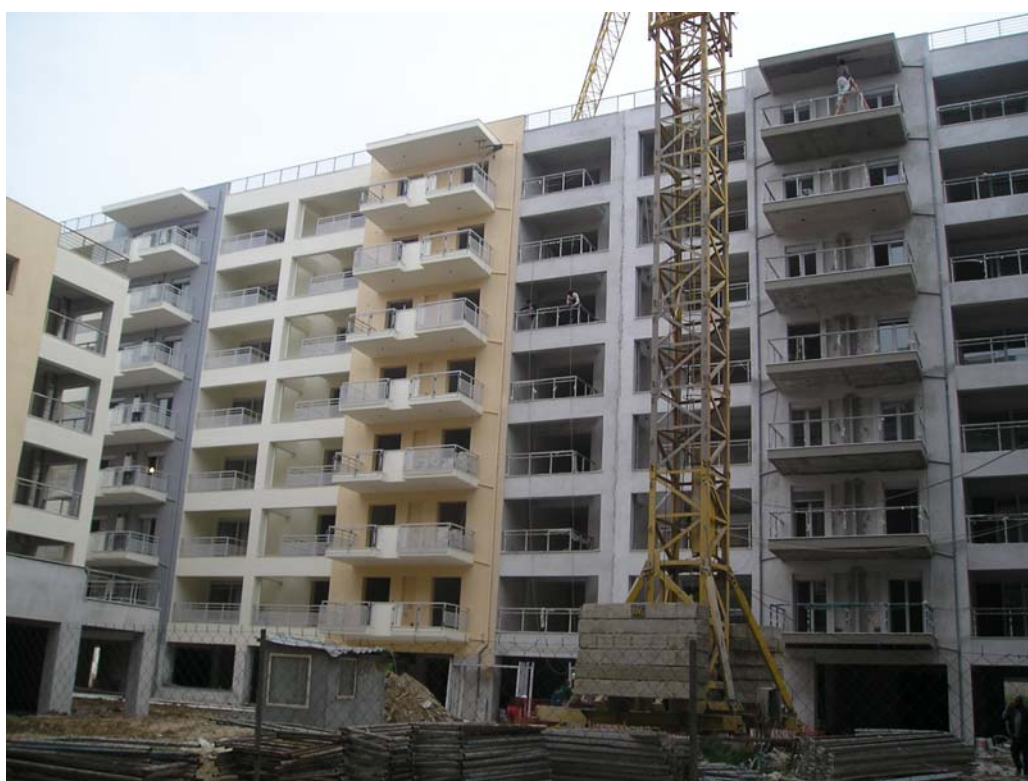
Φωτ. 54,55,56. Λανόκηποι

Οι Λαχανόκηποι της Μενεμένης, αν και γειτνιάζουν με άλλες κεντρικές και πλήρως αστικοποιημένες περιοχές δυτικών δήμων, ανήκουν κατ' ουσία στην επιβαρημένη με οχλήσεις δυτική είσοδο της πόλης και συνεπώς λόγω των τοπικών συνθηκών δεν μπορούν να αποτελέσουν ελκυστική περιοχή κατοικίας