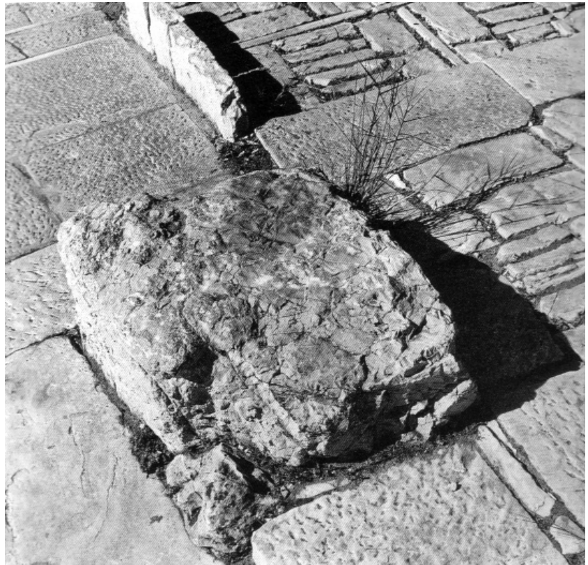
Πικιώνης: Διαμόρφωση διαδρομών στο Λόφο της Ακρόπολης

Όμως παρά τις όποιες διαφορές στις αναλύσεις των μελετητών του χώρου, και το διαφορετικό σημείο εκκίνησης του καθενός, ο τελικός στόχος της προστασίας και της διατήρησης των ιστορικών χαρακτηριστικών του τόπου, παραμένει ο ίδιος. Στην σημερινή μάχιση θεώρηση των προβλημάτων των πόλεων, η παράμετρος της διατήρησης και διαχείρισης των ιστορικών τόπων, αποκτά μια περαιτέρω διάσταση - τη διάσταση της βιωσιμότητας. Αποτελούν ένα πολύτιμο υλικό, ένα απόθεμα χώρου, που μπορεί και πρέπει να αξιοποιηθεί, να εξυπηρετήσει και να συνυπάρξει με τις σύγχρονες ανάγκες.