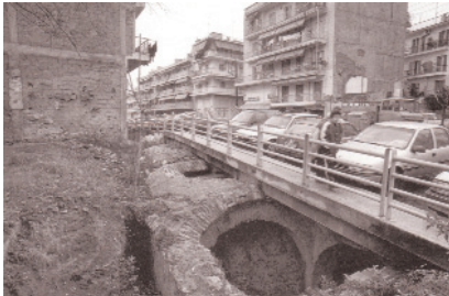
Οδός Ολυμπιάδος - Κινστέρνα (1997)

Η μεγαλύτερη δυσκολία κατανόησης ενός τόπου, έγκειται στο γεγονός, ότι η αντίληψή μας για αυτόν εμπεριέχει καλυμμένη την έννοια του χρόνου. Συσσωρεύει μέσα του ερείπια, σύμβολα, γλώσσες, βιωματικές μνήμες, δεν είναι ποτέ ο ίδιος και έτσι δεν μπορεί να υπακούσει σε μια εύκολη τυπολογική ανάλυση. Μπορεί να δει κανείς τον τόπο ως ένα μουσείο που διατηρεί καταγραμμένες όλες τις ανθρώπινες πράξεις στην διάρκεια του χρόνου.