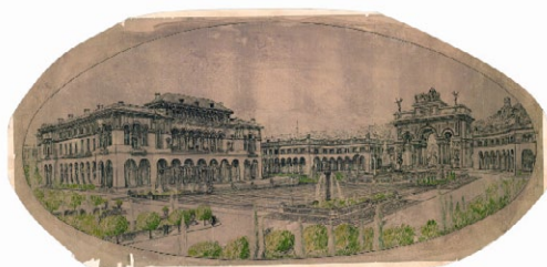
Σχέδιο του Εμπράρ, ιδιοκτησίας ΤΕΕ/ΤΚΜ

Η εφαρμογή του σχεδίου Εμπράρ στην πράξη ανέδειξε κι άλλες παθογένειες που εξακολουθούν να υφίστανται στη σημερινή ελληνική -και όχι μόνο